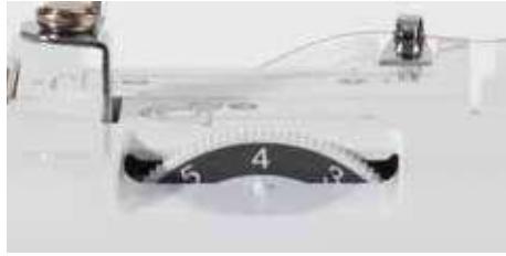
Réglage de la tension du fil