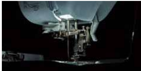
Éclairage LED super lumineux