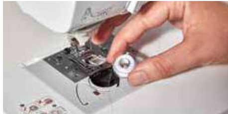
Mise en place rapide de la canette