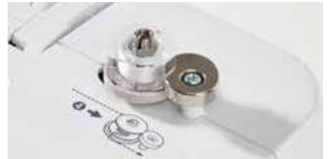
Système de remplissage de la canette