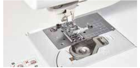
Entraînement à 7 griffes