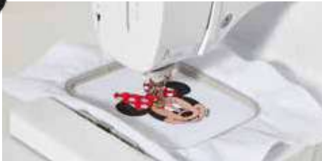
Champ de broderie de 100 x 100 mm