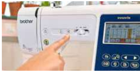
Commandes à portée de main