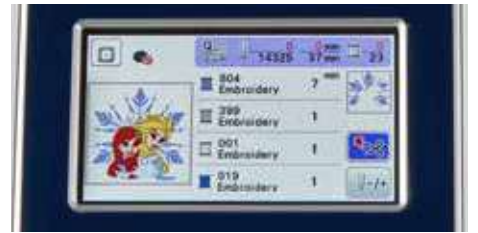
Écran tactile couleur LCD 9,4 cm