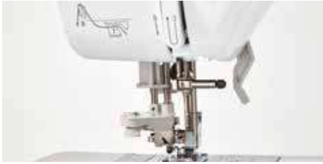
Système d'enfilage de l'aiguille avancé