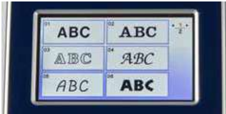
Styles de polices de caractères intégrés