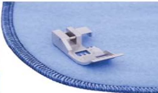
Pied pour coudre des courbes

Ce pied s'emploie pour coudre des courbes en faveur de sa forme courte et de sa sous-partie réfractaire. Il glisse à travers des coutures transversales et d'accroissements aisément. D'autres emplois pour ce pied pour coudre des courbes sont : coudre des manchettes, encolures, manches et vêtements pour enfants.