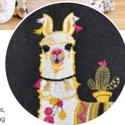
Divers motifs amusants, de quilting et de bordure