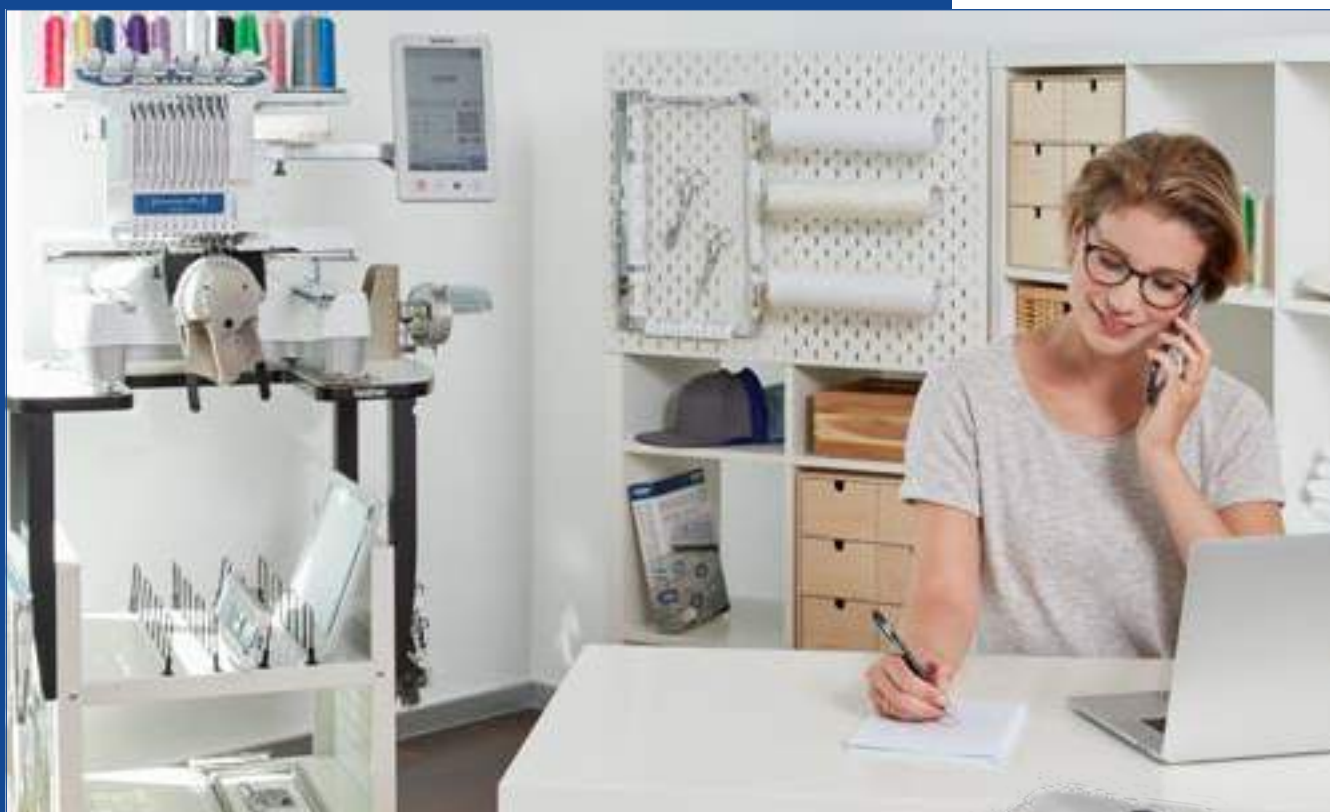
Table pour la broderie tubulaire*, pour gérer les grands ouvrages