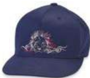
SYSTÈME CASQUETTE À BORD PLAT