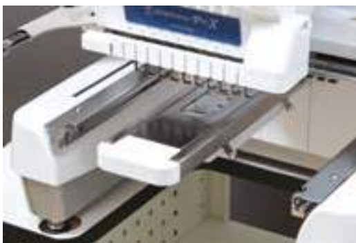
Table pour la broderie tubulaire (PRTT1)