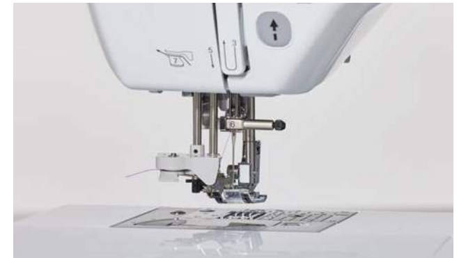
Système d'enfilage de l'aiguille extra-avancé