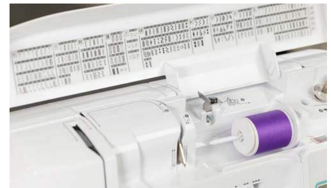
241 points de couture utiles et décoratifs intégrés