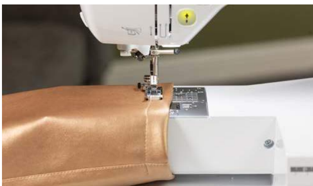
Couture à bras libre