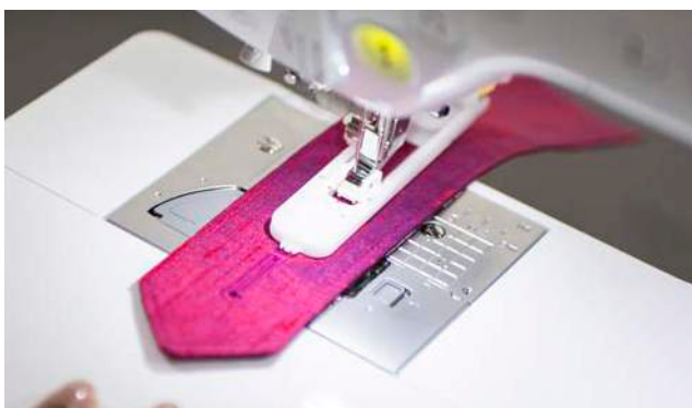
10 styles de boutonnières automatiques en 1 étape